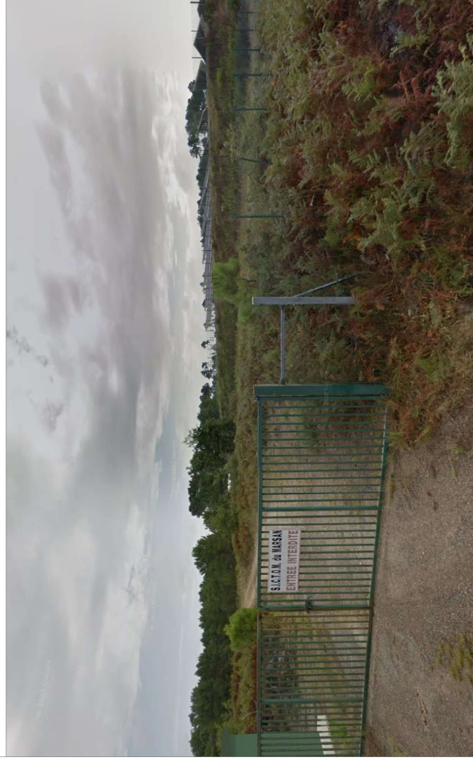
Vue en perspective du projet