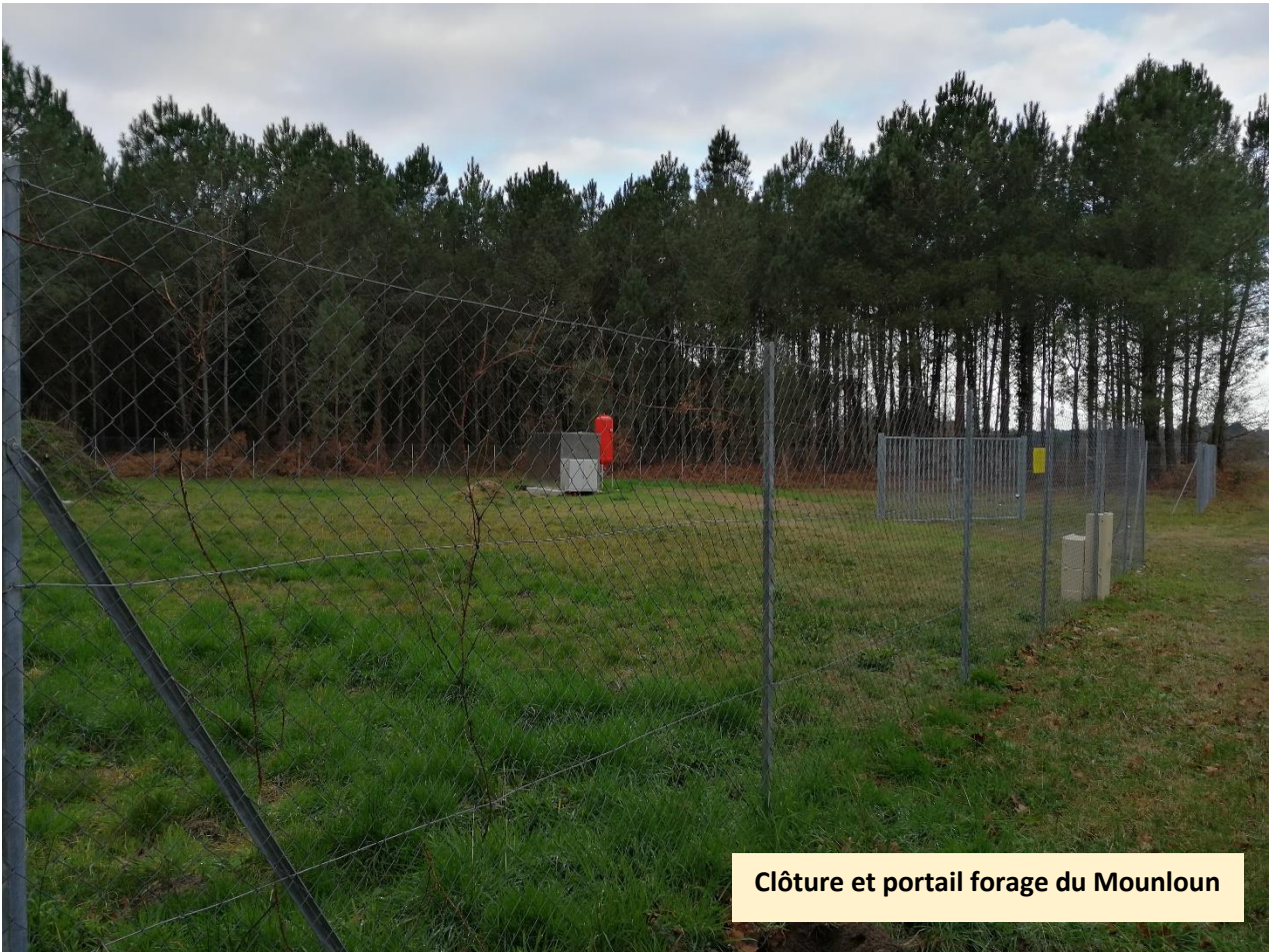
Clôture et portail forage du Mounloun