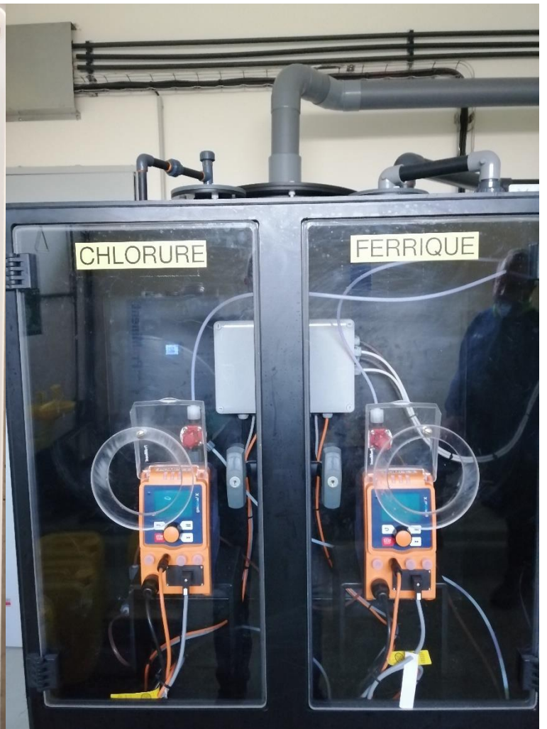
Filière de traitement