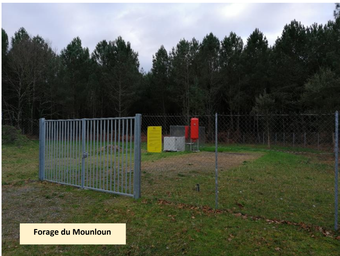
Forage du Mounloun