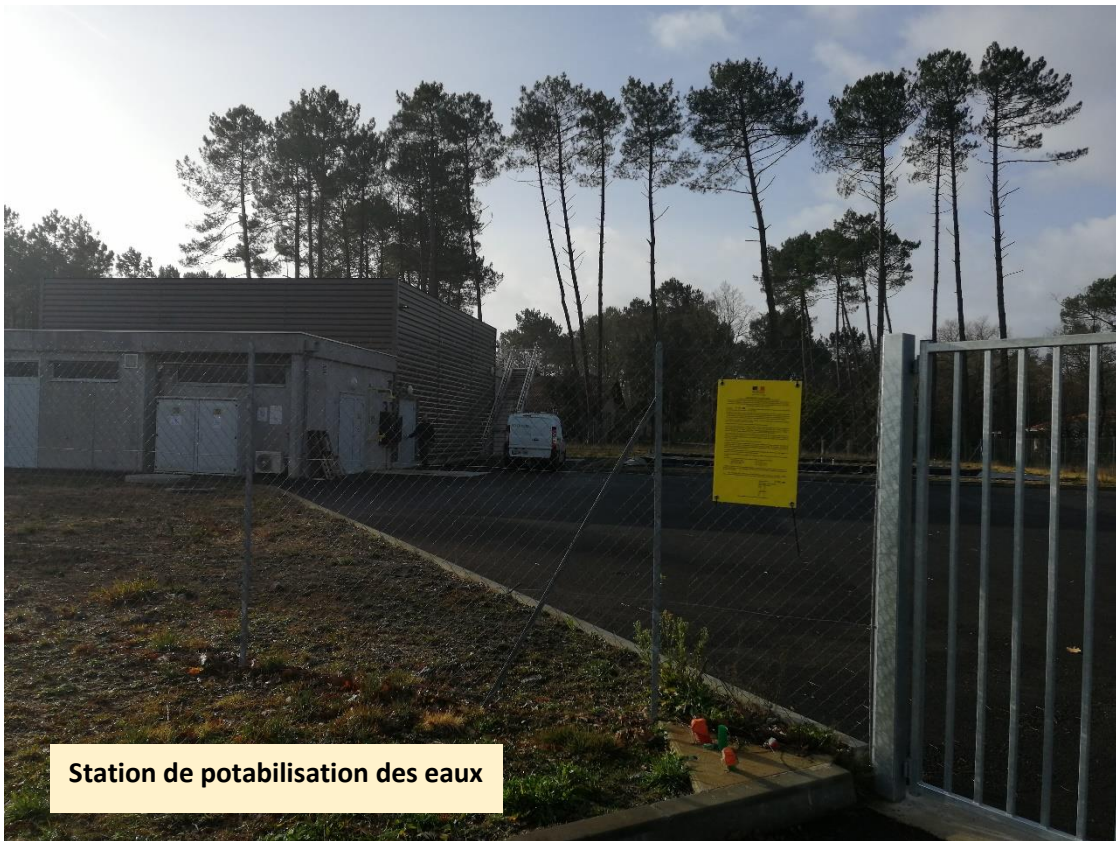
Station de potabilisation des eaux