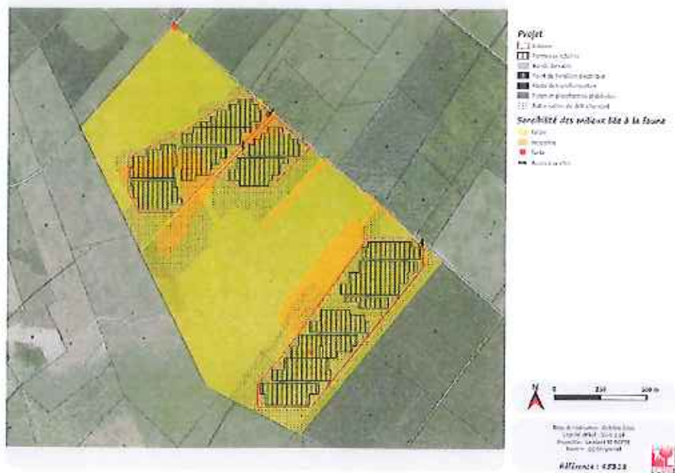
Carte 34 : Implantation des installations PV à vis des sensibilités faunistiques