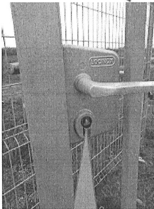
Serrure avec Triangle mâle 12 x 12 x 12 mm